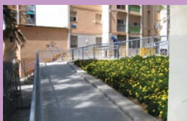
Rampas para mejorar la accesibilidad entre la c/ Bambú y la plaza Antonio Machado.