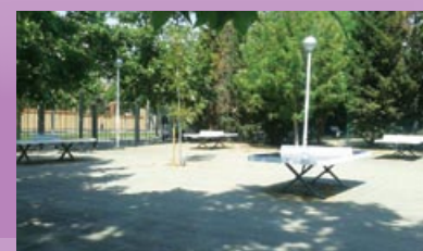
Colocación de 2 mesas nuevas de ping pong en el parque de la Infanta.