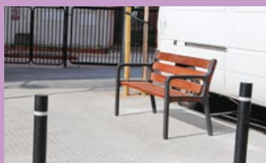
Banco en la calle Costa Brava.